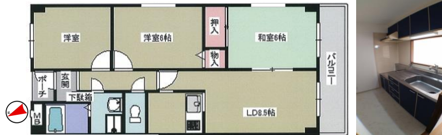
505号間取図(反転タイプ) ※図面と現況が違う場合は、現況優先となります。予めご了承下さい。