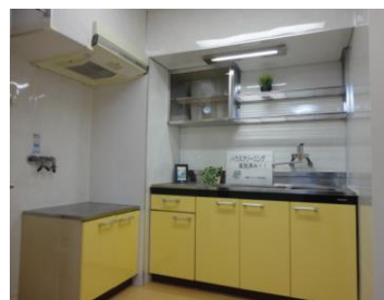
<デザインキッチン>