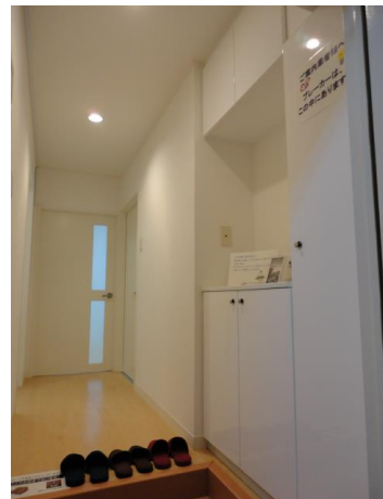
<白を基調とした清潔感のある玄関>