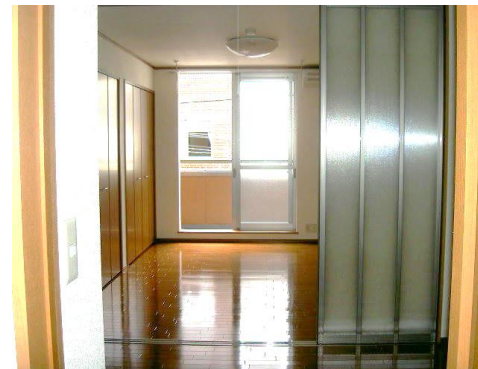
※写真はイメージ・現況優先