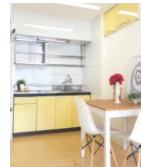
デザインキッチン