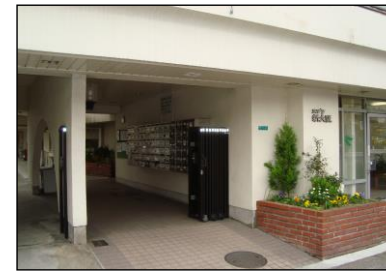
開放的なエントランス