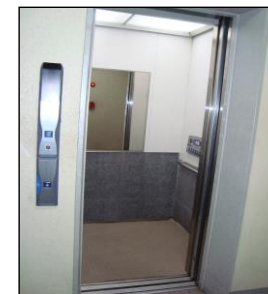
エレベーター改修済み