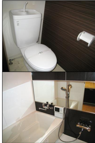
※現況優先 写真はイメージです