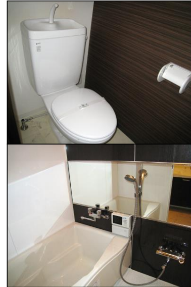
※現況優先 写真はイメージです