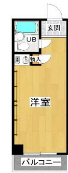
ワンルームタイプ