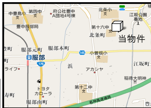
図面はあくまでも概略図です。現状と異なる場合は現状を優先させていただきます。