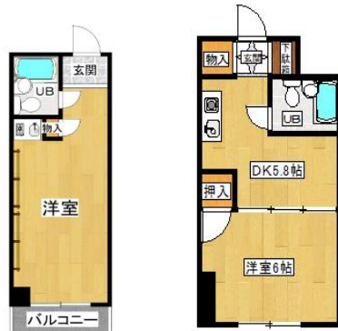
ワンルームタイプ