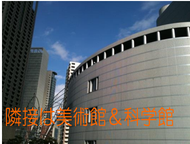
隣接は美術館 & 科学館