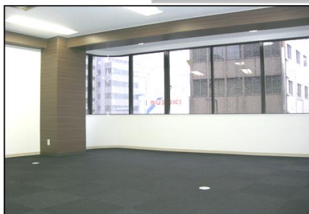
写真はリフォーム完了後のイメージです。