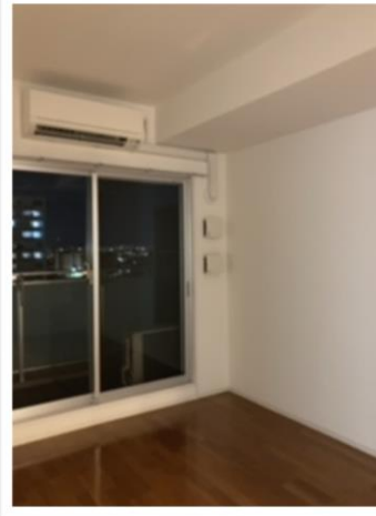
◆嬉しいエアコン付き♪