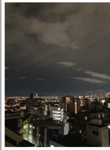
◆最上階。窓からの見晴らしは最高です。